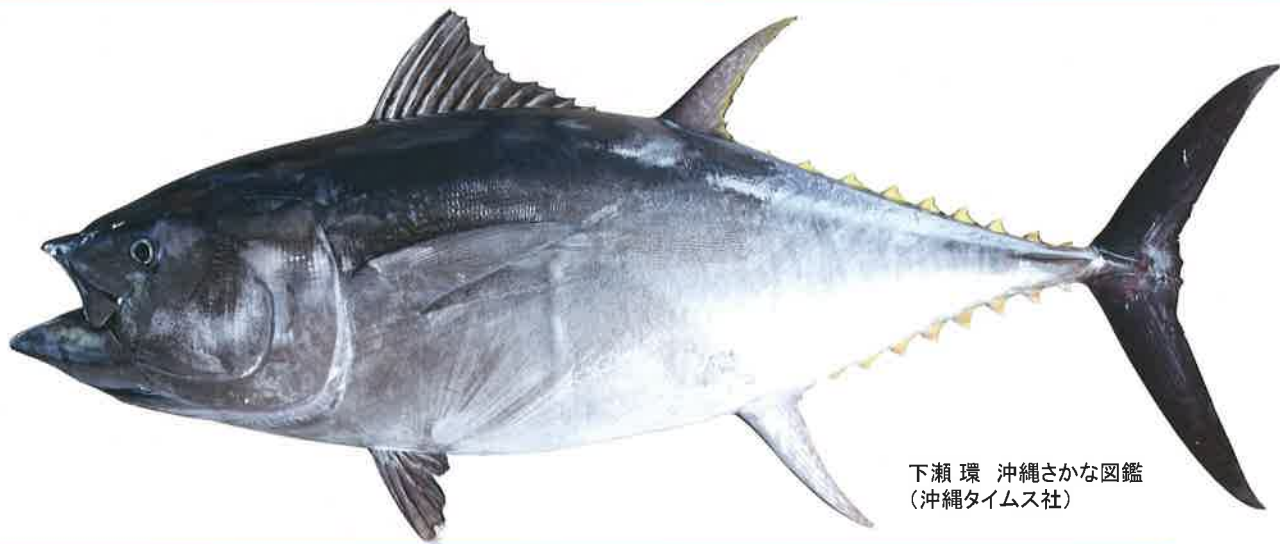
下瀬 環 沖縄さかな図鑑 (沖縄タイムス社)